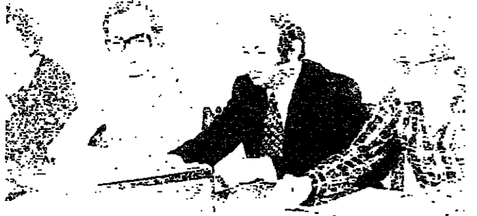
لجنة الخريجين في مؤتمرها الصحفي أمس

بشكل كارثي ٣ - أطباء التعميمات سينخروون على يد أساتذة لا يفتخرون في المجال الذي تولاها عرضت فيه المشاكل التي تواجه الخريج والغالب بسبب التخصص